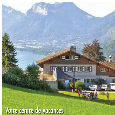
Votre centre de vacances

Les excursions sont susceptibles d'être modifiées en fonction des besoins du groupe.