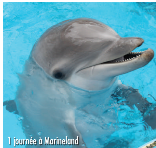
1 journée à Marineland